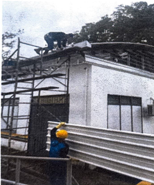
Fotografía 1. Proceso de desmontaje de cubierta, instalación de la nueva cubierta