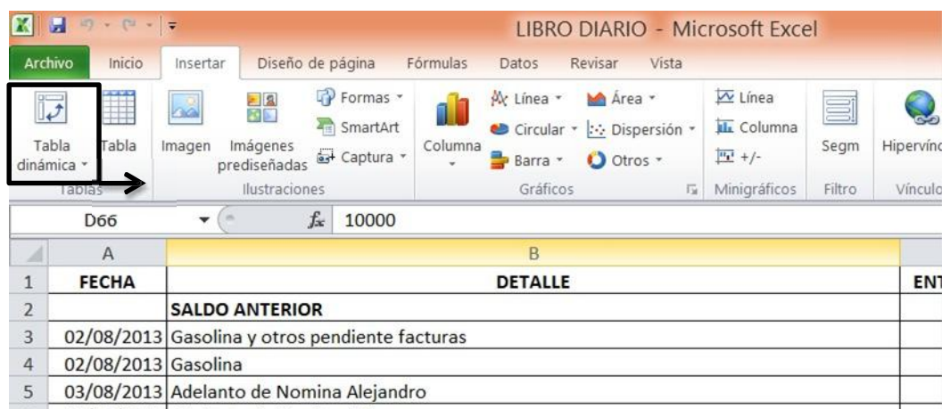
Figura 3. Tabla dinámica